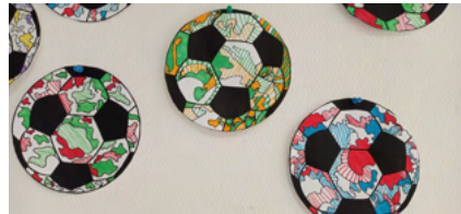
à la manière de Dubuffet- CE1

Notre classe de CM2 a participé à un concours de décoration de cochons sur le thème des jeux olympiques. Les cochons seront à vendre pendant les portes ouvertes, au profit de la banque alimentaire !