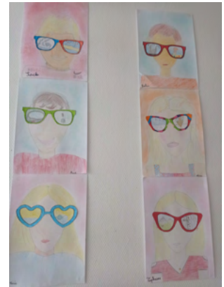
Souvenirs de vacances- CM1