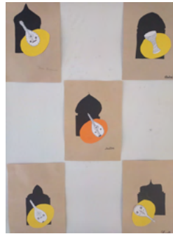
Portes orientales en lien avec le concert - CM1