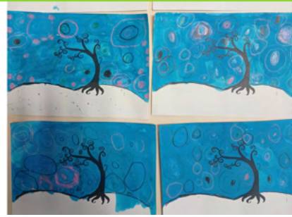
L'hiver à la manière de Wescoat- CP