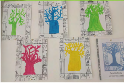
L'arbre bleu à la manière d'Alechinsky – CP-CE1