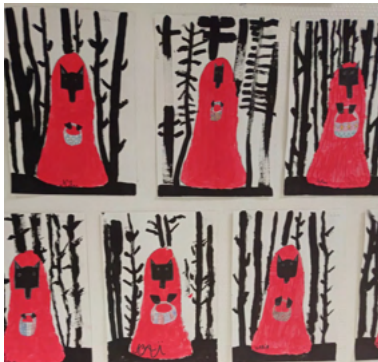
Le chaperon loup- CE2